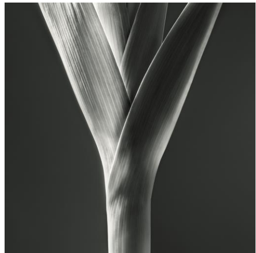
Nature - Poireau , 2013. Edition de 7, 120 x 120 cm

© 2015. Jean-Baptiste Huynh – Courtesy Galerie Lelong