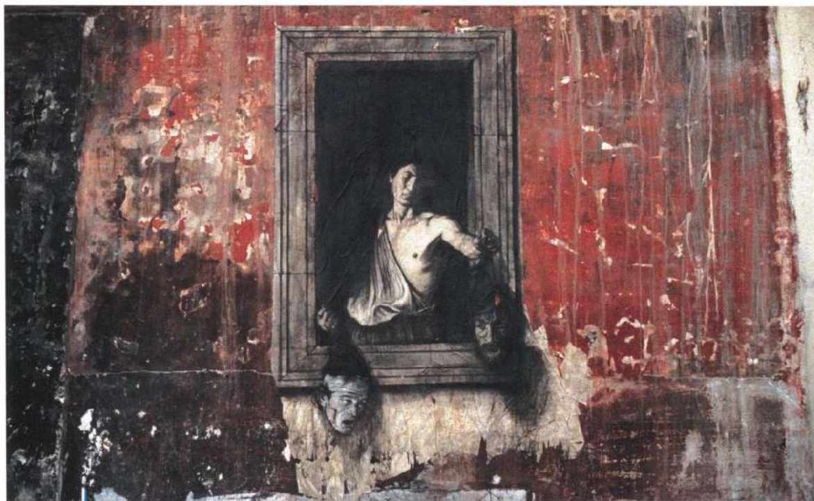
David et Goliath (d'après Caravage) réunissant les têtes tranchées de Caravage et Pasolini, Naples, 1988, dessin à la pierre noire en situation.

mais également par le sens plastique des interventions esthétiques, à Naples ou Soweto. Enfin, ce florilège offre à tous les figures du poétique, de Rimbaud à