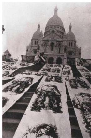
La Commune, Paris, 1971, sérigraphies en situation.

les réalités des villes, des événements réincarnés par ses interventions. Ernest Pignon-Ernest s'attèle toujours à une série d'études – encre, gouache, crayon – avant la réalisation des sérigraphies qu'il appose en franc-tireur. Il colle ses images de nuit, seul ou aidé par sa compagne, Yvette Ollier, en choisissant avec stratégie son emplacement. La Commune ou les Gisants à Paris en 1971 sera cette campagne où ses sérigraphies jonchent le sol et les escaliers de la Butte Montmartre, du Père-Lachaise, du métro Charonne et de la Butte-aux-Cailles... Suivent Jumelage Nice/Le Cap (1974), Sur l'avortement (1975), Les expulsés (1979), Prométhée (1982), Naples (1988), Derrière la vitre (1996), Prisons (2012). Et les autres... Traversées par les enjeux propres à l'engagement de l'artiste, depuis les années 1970 jusqu'aux récentes Prisons ,