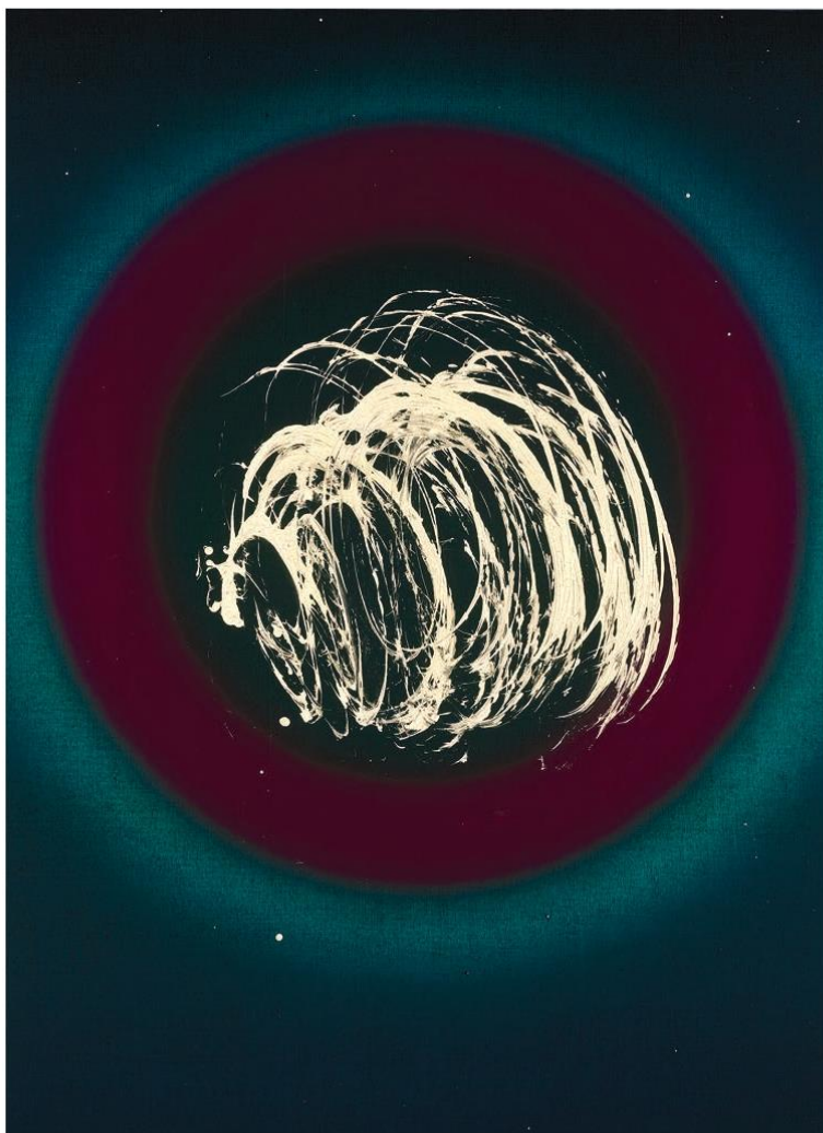
Rainbow Painting, 2021. Acrylique et technique mixte sur toile acrylic and mixed media on canvas. 183 x 135 cm