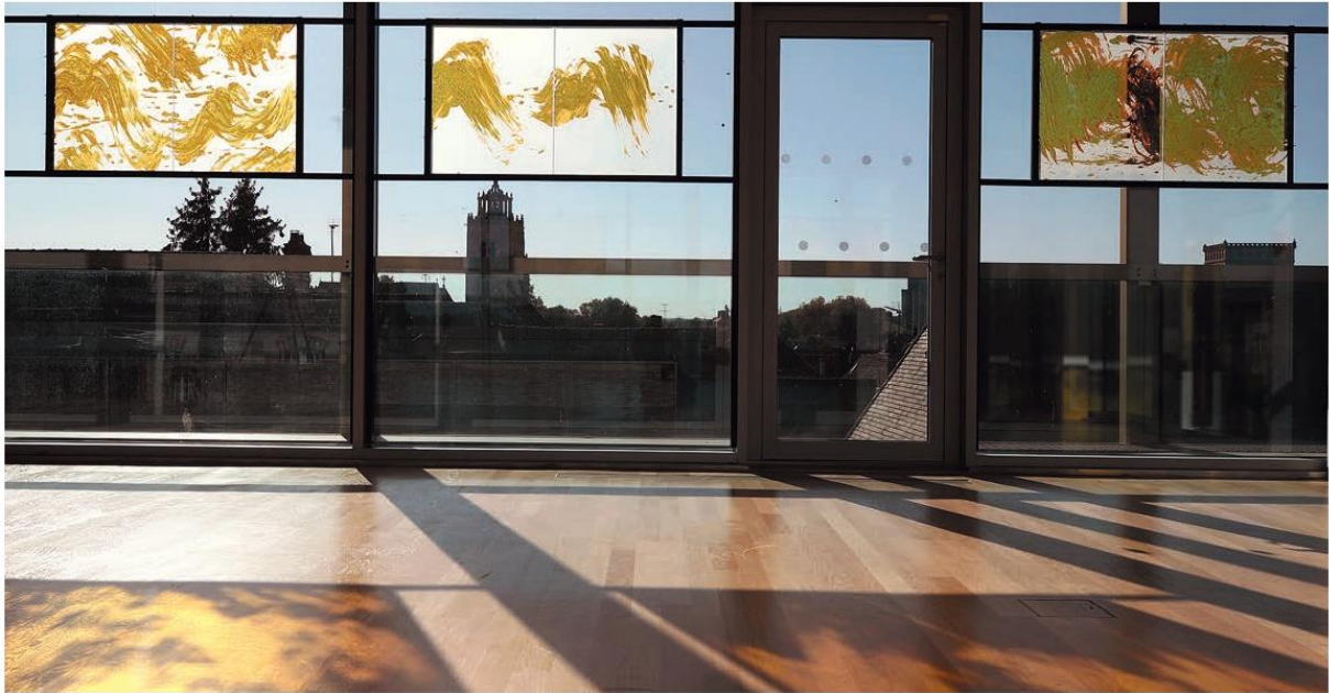
Série series Topographies imaginaires. Musée Camille Claudel, Nogent-sur-Seine, 2022. Avec with Flavie Serrière Vincent-Petit. (Cette double page this spread : © Christophe Deschanel)

comes light through the alchemy of fire," she says. "Something of the dream of deformation enters the soul of the worker," Bachelard wrote. For Fabienne Verdier, this is the dream of abstraction, essential, symbiotic with the universe. An elemental form of painting.