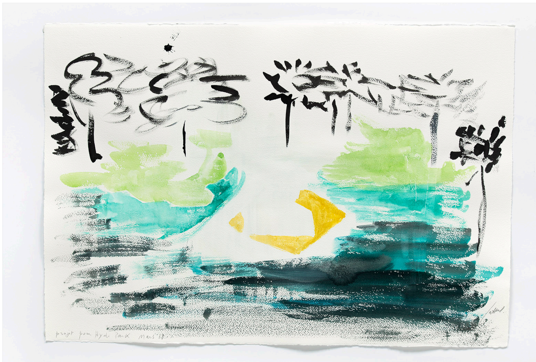
Simone Fattal, Projet pour Hyde Park , 2019, aquarelle et encre sur papier, 57 x 76 cm, w23098