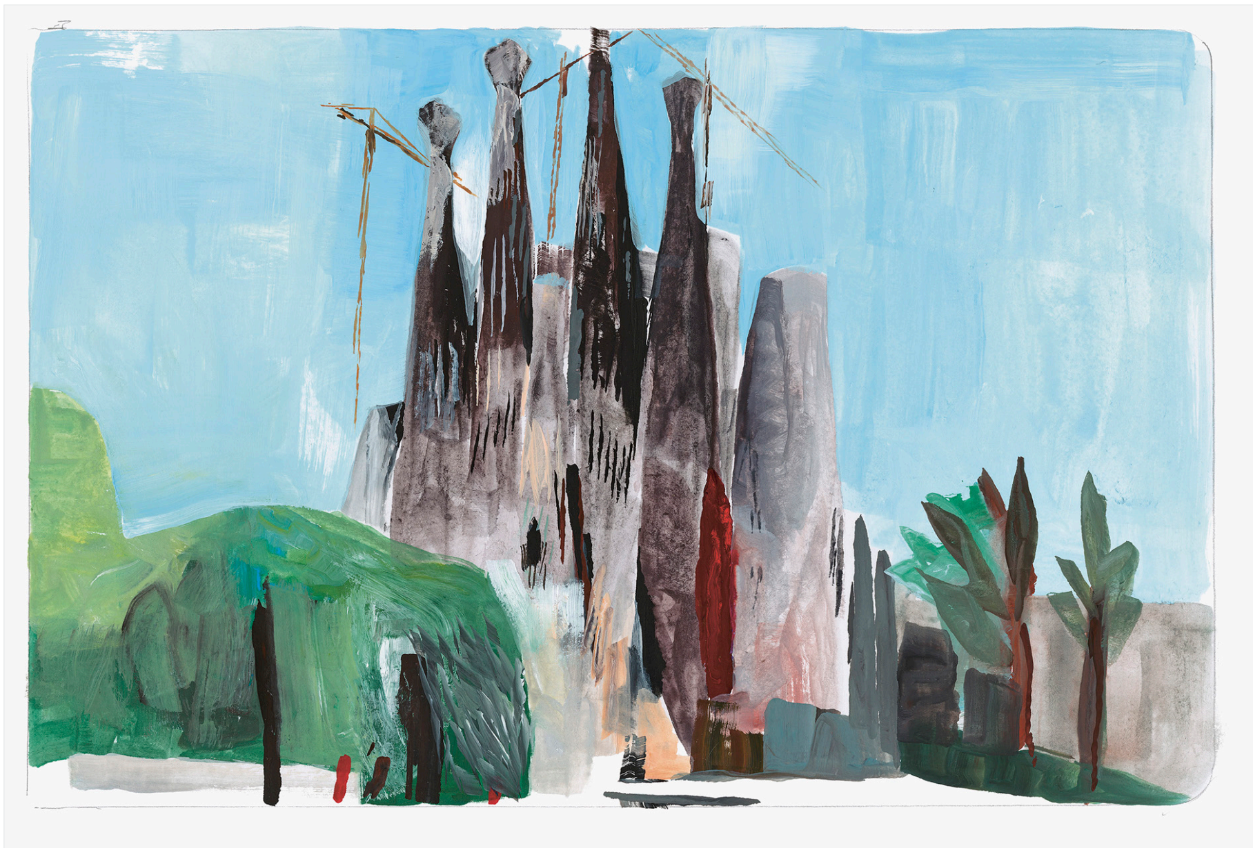
Marc Desgrandchamps, Barcelona, La Sagrada Família , 2018, gouache sur papier, 20 x 29 cm, w22305