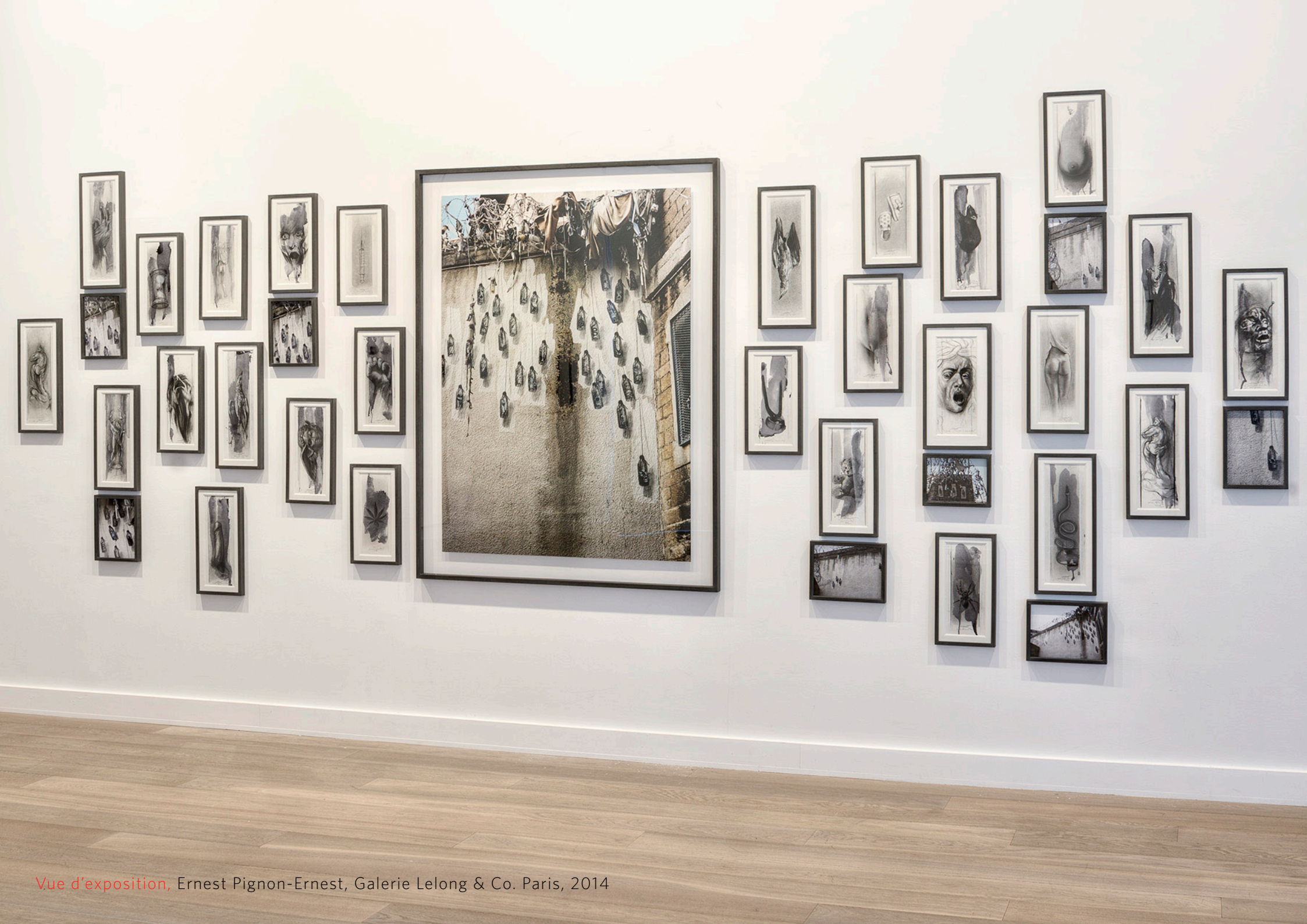
Vue d'exposition, Ernest Pignon-Ernest, Galerie Lelong & Co. Paris, 2014