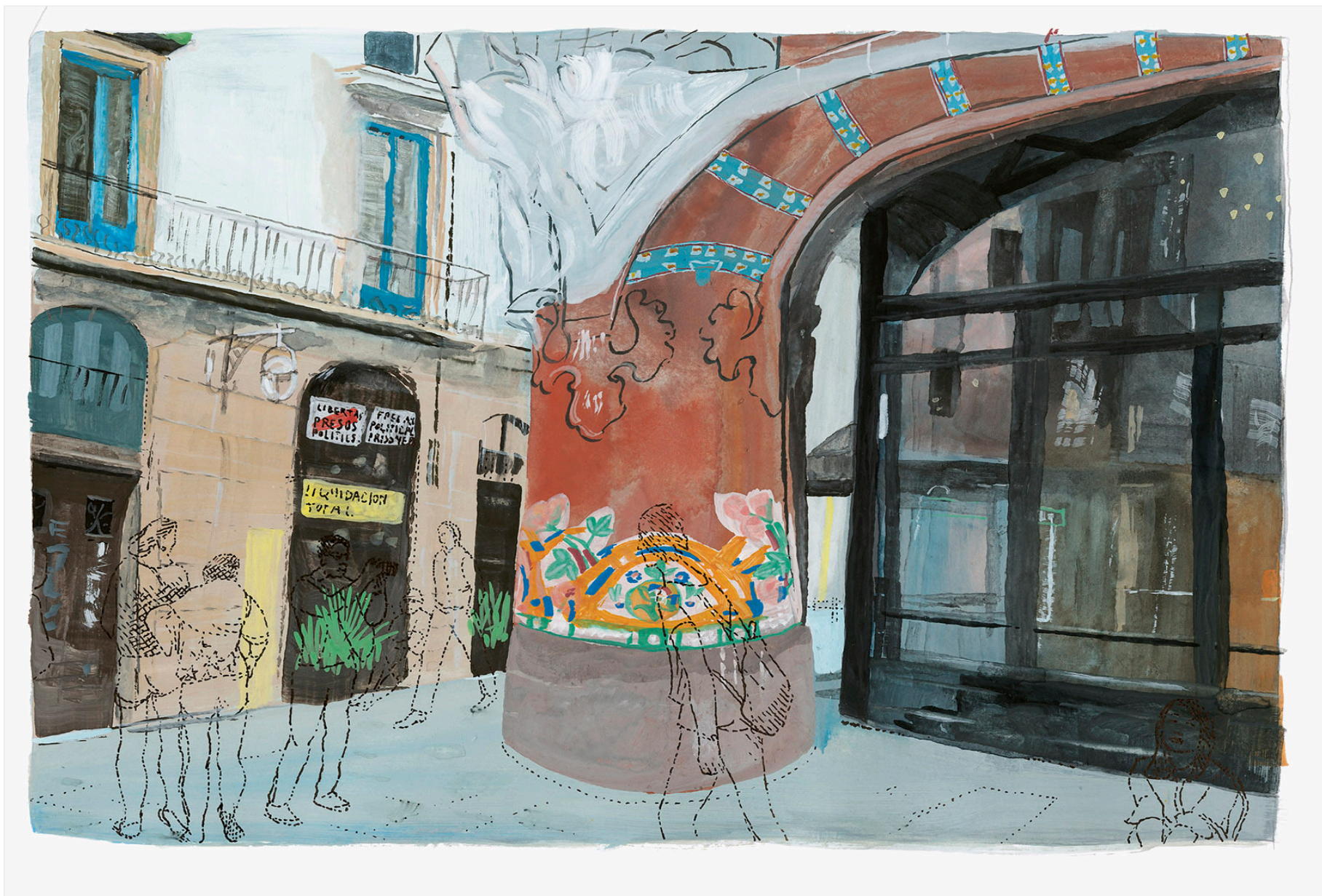
Marc Desgrandchamps, Barcelona, Ribera , 2019, encre et gouache sur papier, 20 x 29 cm, W22323