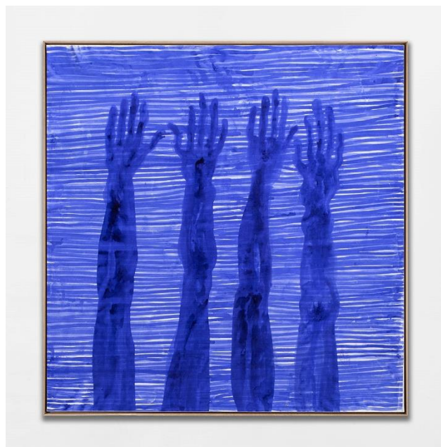
Partage VII , 2020, encre sur toile, 200 x 200 cm.

« L'année 2021 marque le trentième anniversaire de la disparition de l'écrivain poète d'origine africaine (Egypte) Edmond Jabès. Son œuvre n'a pas cessé de nous illuminer. Edmond Jabès, par ce qu'il a su interroger et formuler, est en phase avec ma vision du monde, et son œuvre entre en résonance avec mes pratiques artistiques. Une complicité de pensée s'est avérée à la lecture de ses écrits. L'approche de l'univers d'Edmond Jabès, en particulier son Livre du partage , m'a permis de concevoir une proposition artistique pendant la Biennale internationale de Busan 2020, en Corée ; il en a résulté la série des 8 peintures Partages I - VIII .